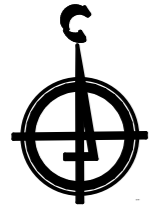
Схема планировочной организации земельного участка М 1:500